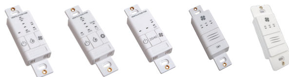
99-BC02 99-BC03 99-BC04 99-DET02 99-DET01

99-RX02 - Répéteur sans fil Lifebreath Augmente la portée des minuteries sans fil 99-DET02. Se branche dans une prise de courant de 120 V. Connectivité sans fil entre la commande principale et à la minuterie 99-DET02. Installation à mi-chemin entre la minuterie et la commande principale au mur si la minuterie est hors de portée.